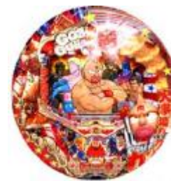
【各種パチンコ盤面】