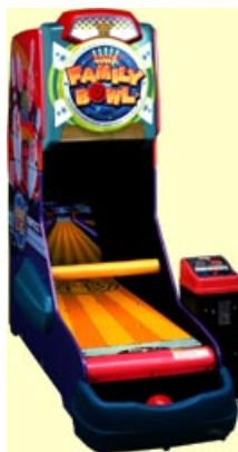
【ファミリーボール】