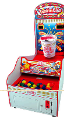
【ファンファンカップ】