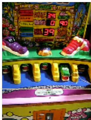
【ワニワニパニック】

今回掲載されている機種以外にも様々な機種がございますが、代表的な機種を今回はご提案させていただきます。